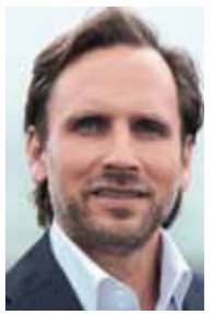
Oliver Bludau Berghoff GmbH

Ergonomie bedeutet für uns, alles zu unternehmen, was unseren Mitarbeitern die Arbeit an den Maschinen und mit den Werkzeugen leichter macht und im Sinne eines betrieblichen Gesundheitsmanagements förderlich ist, ohne die wirtschaftlichen Ergebnisse und die Produktivität zu belasten. Wir möchten, dass technische, mechanische und menschliche Abläufe optimal interagieren und so Ressourcen in jeder Beziehung geschont werden. Unser wichtigstes Gut sind leistungsfähige und motivierte Mitarbeiter. Deswegen ist Ergonomie – insbesondere wenn es um Belastungen des Rückens, der Wirbelsäule oder der Gelenke geht – ein Fokus im Rahmen einer wirtschaftlichen Gesamtbetrachtung. Beim Kauf einer neuen Maschine schauen wir zunächst einmal nach den technischen Daten und den Kosten. Hier schränkt sich die Auswahl häufig schon auf ein oder zwei Optionen ein. Ergonomie steht also nicht an erster Stelle. Gleichwohl ist Ergonomie auch eine Frage optimaler Prozesse. Deswegen spielt sie eine entscheidende Rolle in der Anwendungspraxis. Hier nehmen wir regelmäßig das Feedback der Mitarbeiter auf und geben dies auch an unsere Lieferanten weiter. Insbesondere von diesen erwarten wir, dass sie das Thema bereits bei der Planung der Maschinen mit berücksichtigen. Im Dialog mit den Mitarbeitern und den Lieferanten einerseits und in den betriebsinternen Abläufen und Prozessen andererseits liegt eine kontinuierliche Verbesserung auch im Bereich ergonomischer Arbeitsplätze.